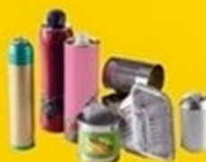
Emballages métalliques et aluminium