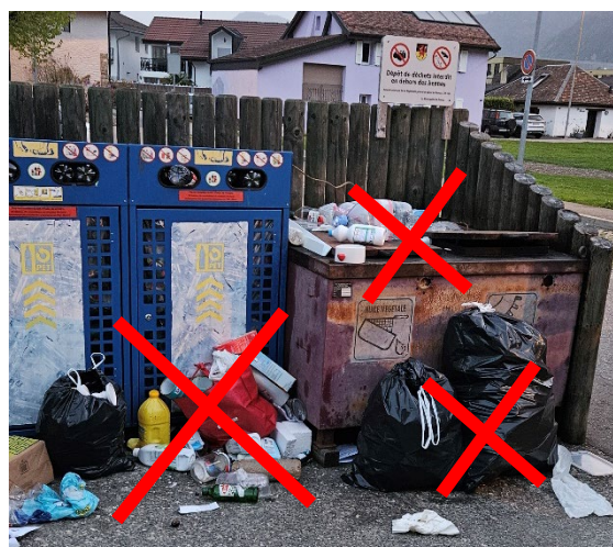
Déchets laissés au sol