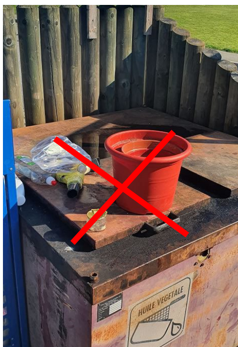
Déchets non valorisables à éliminer dans un sac poubelle