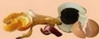
Déchets de cuisine