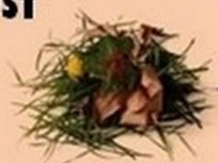
Déchets de jardin