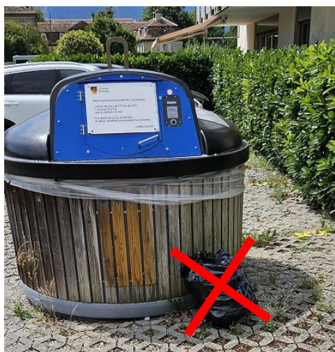
Sac poubelle à côté du Molok