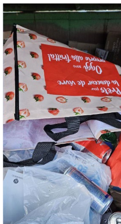
Plastiques et alu dans la benne à papier

Tout dépôt non conforme est passible d'une amende de CHF 150.-- + frais, conformément à l'article 17 du Règlement sur la gestion des déchets :