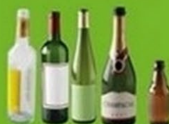
Bouteilles et flacons en verre