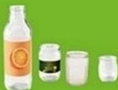
Pots et bocaux en verre